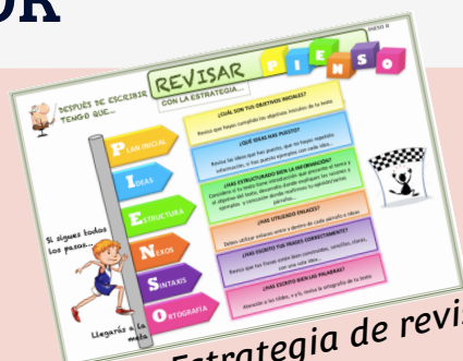
PIENSO: Estrategia de revisión